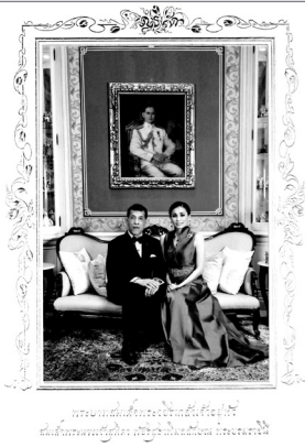
พระบาทสมเด็จพระเจ้าอยู่หัว และสมเด็จพระราชินีสุทิดา สมเด็จพระนางเจ้าสิริกิติ์ พระบรมราชินีนาถ พระบรมราชชนนีพันปีหลวง

พระบาทสมเด็จพระเจ้าอยู่หัว มีพระราชดำรัสอำนวยการ แก่พสกนิกรไทยในโอกาสขึ้นปีใหม่ พ.ศ. 2563 โดยขอให้ มีกำลังกาย กำลังใจ และสุขภาพที่แข็งแรง สติปัญญาอ่อนใส มีศรัทธาและความสำนึกในการประพฤติและดำรงตนใน กรอบของความดีงาม ถูกต้อง และพอเหมาะพอควร มุ่งมั่นที่ จะร่วมสร้างประโยชน์ให้แก่ประเทศชาติและส่วนรวม.