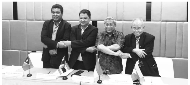
ผู้แทนสภาการหนังสือพิมพ์แห่งชาติ สภาสื่อมวลชนเมียนมา สภาสื่อมวลชน อินโดนีเซีย สภาสื่อมวลชนติมอร์เลสเต ร่วมประชุมใหญ่ครั้งแรก (Inaugural General Assembly) ที่เกาะบาหลี่ อินโดนีเซีย เพื่อพิจารณาร่างธรรมนูญ ของเครือข่ายสภาสื่อมวลชนแห่งเอเชียตะวันออกเฉียงใต้ เมื่อวันที่ 4 ธ.ค. 62

โดยเฉพาะอย่างยิ่ง การกำกับดูแลกันเองทาง (อ่านต่อหน้า 10)