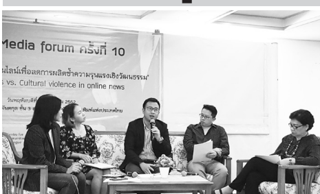
สภาการหนังสือพิมพ์แห่งชาติ ร่วมกับภาคีเครือข่าย จัดเสวนามีเดียฟอรัม ครั้งที่ 10 ในหัวข้อ "จริยธรรม การสื่อสารออนไลน์เพื่อลดการผลิตซ้ำความรุนแรงเชิงวัฒนธรรม" เมื่อวันที่ 19 ธ.ค. 62

สภาการหนังสือพิมพ์ฯ ออกแนวปฏิบัติ การใช้สื่อสังคมออนไลน์ วางกรอบการทำงาน พร้อมจัดเสวนาลดการผลิตซ้ำความรุนแรงใน สื่อออนไลน์ เชื้อต้นเหตุมาจาก อคติ ความเร่งรีบ และหวังรายได้ผ่านยอดวิว แนะนำสร้างความ เข้าใจของสังคมร่วมตรวจสอบข้อเท็จจริง